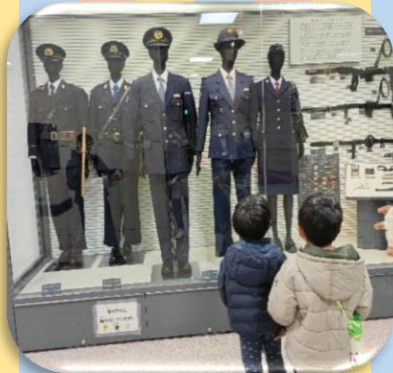
ちょっとムズカシイ(^▽^) 警察官の持っている物や制服 の違いを教えてもらったよ!