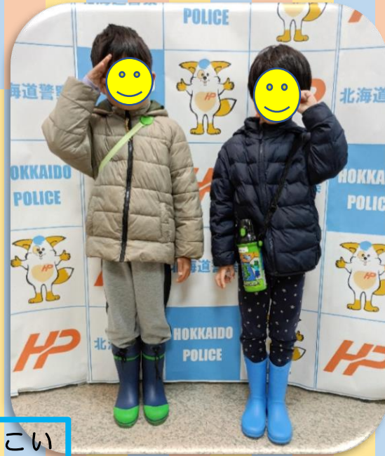
記者会見みたいにハイチーズ♡