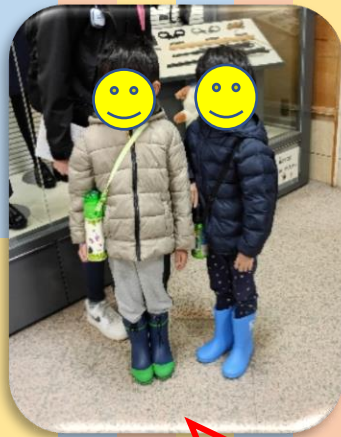
フリーズ中の二人 ・・・(*^~^*)v