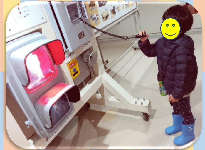
スイッチを使って遠隔操作を 体験したんだよ!